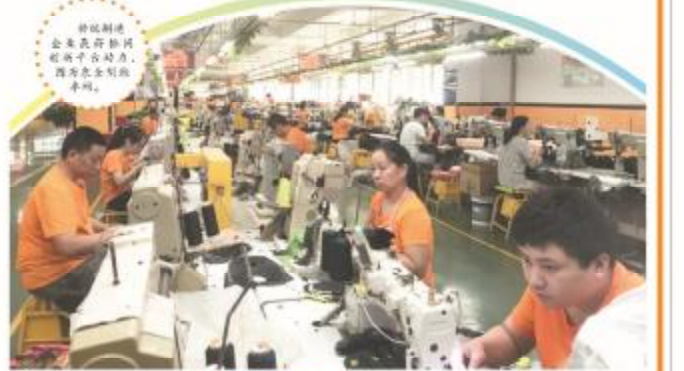
坚持以人为本 促进成果落地

为深入贯彻“十四五”规划要求，泉州各特色产业纷纷推出共享服务“平台+”工程，为产业升级注入新动能。