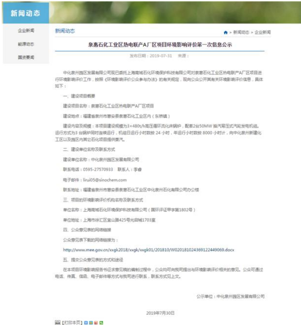
图 2.1-1 第一次网络公示图